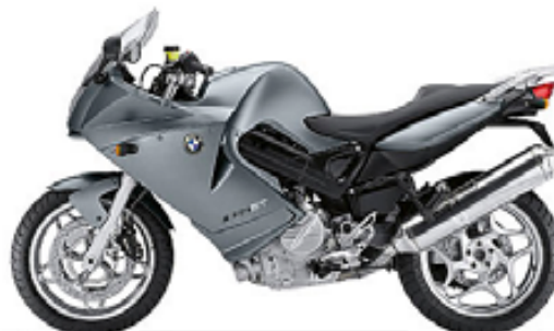
graphitan 2 métal mat