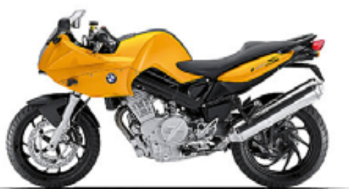
jaune sunset uni